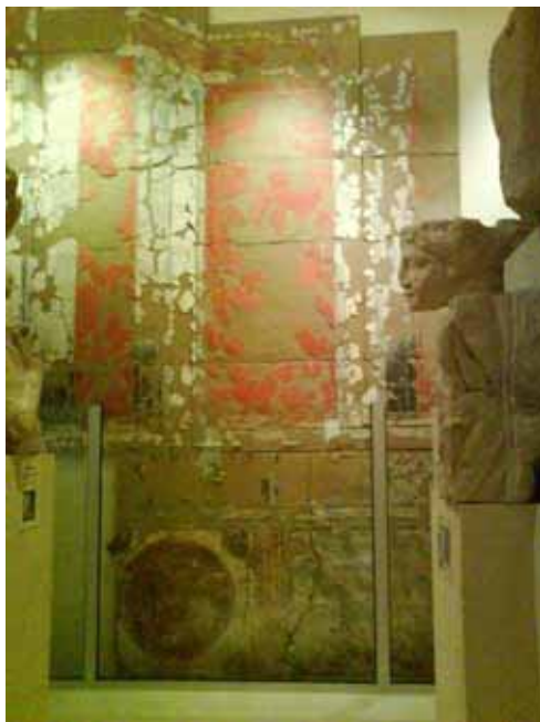
Enduits-peints du temple restitués sur un pan de mur du Musée de Guiry-en-Vexin