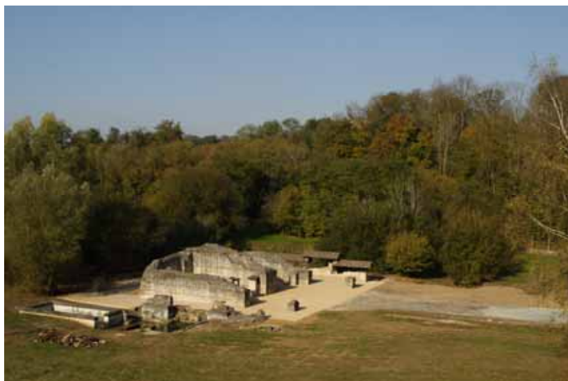
Vue d'ensemble du temple après son aménagement pour sa valorisation