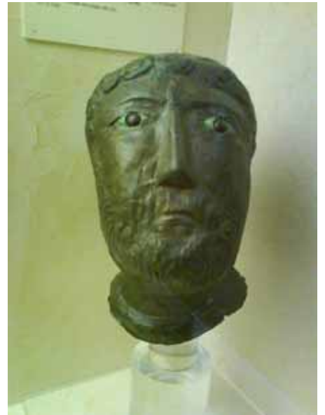
Masque en bronze