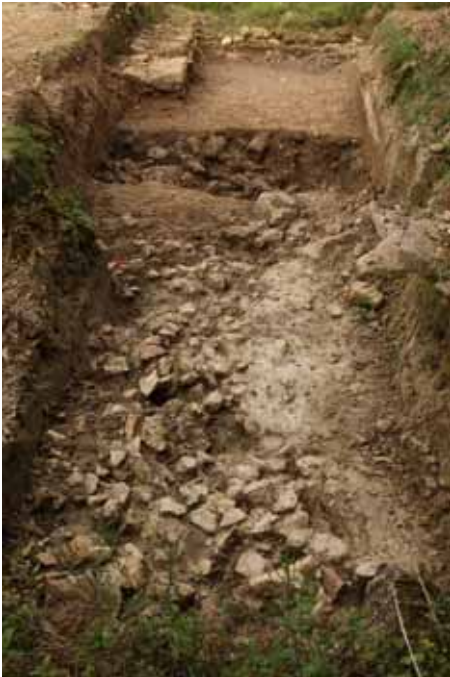
Zone nord de la voie d'allée