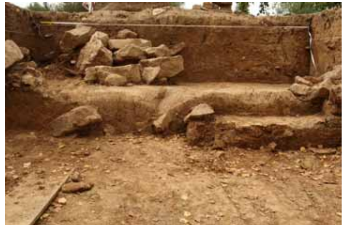
Sondage près du bâtiment secondaire IX