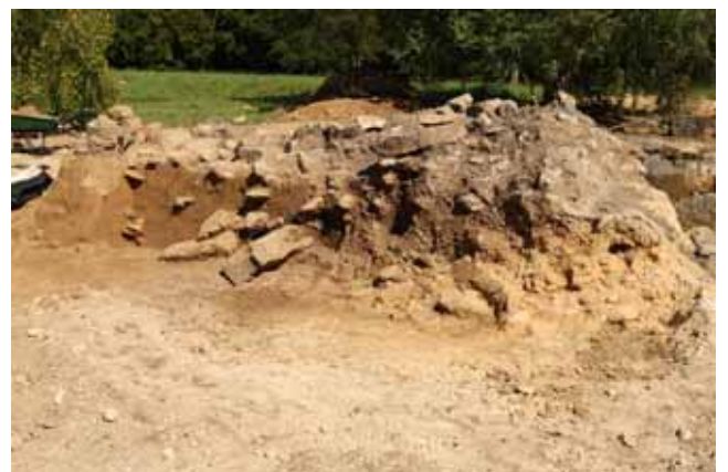
Découverte d'un atelier de taille mérovingien Près du BS IX