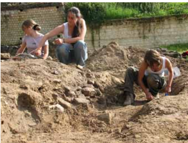
Zone en cours de fouilles