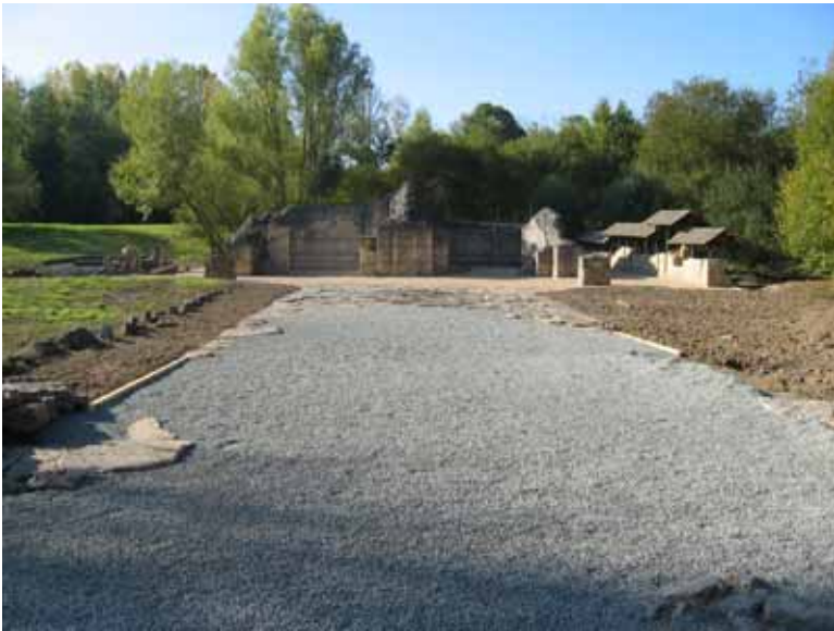
Le temple de Genainville