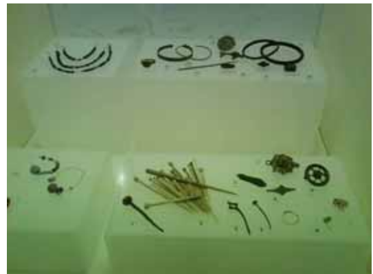
Parures gallo-romaines exposées au Musée Départemental d'Archéologie de Guiry-en-Vexin