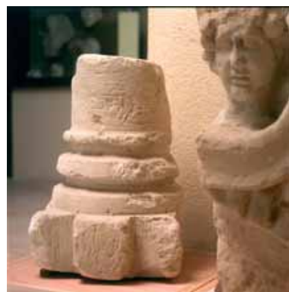
Colonne provenant du Temple