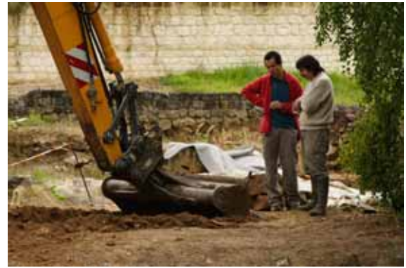
Opération de gros oeuvre