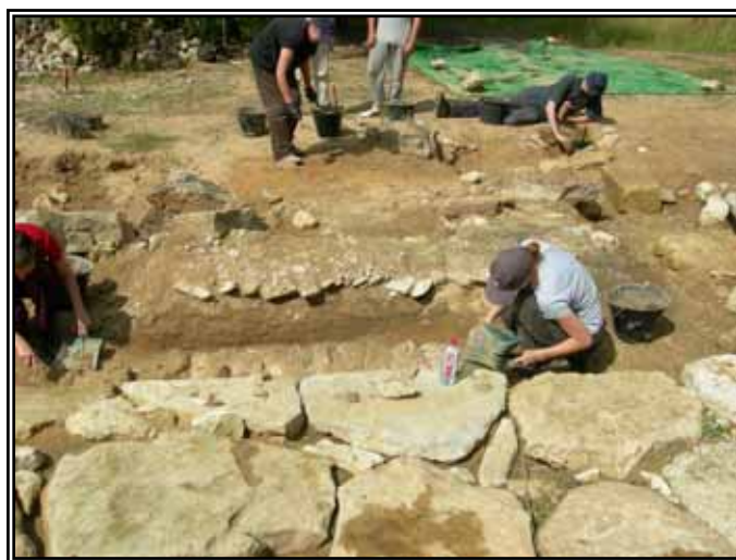
Zone est voie dallée