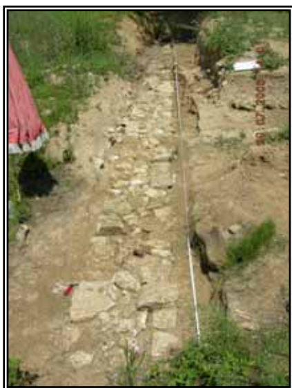
Zone nord d'allée sacrée