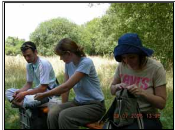
Fouilleurs en repos