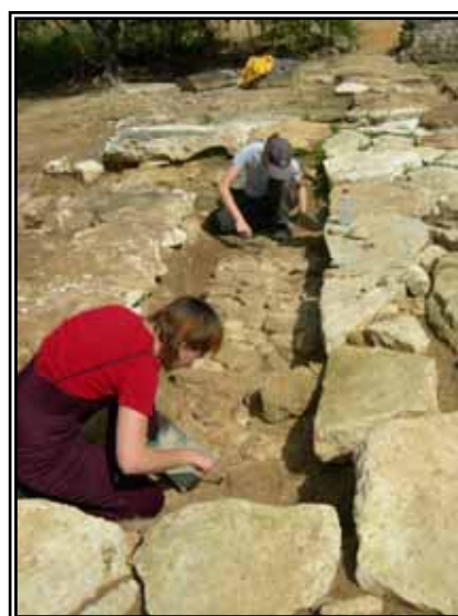
Travail minutieux et concentration malgré la canicule