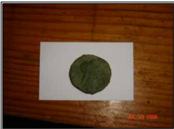
Exemple de monnaie retrouvée lors de fouilles