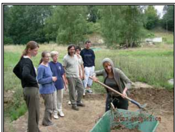
Fouilleurs dans l'effort (petit cours de pelle)