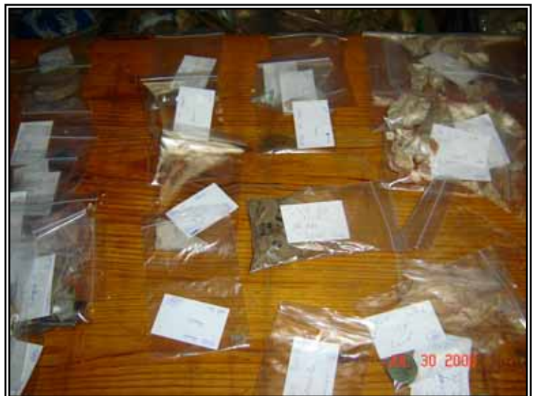
Nettoyage, inventaire et enregistrement du matériel